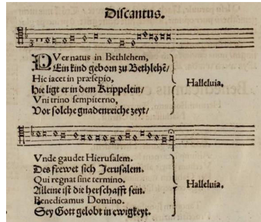
Lucas Lossius: Psalmodia, hoc est cantica sacra veteris ecclesiae , Nürnberg 1553, S. XXVIII

Der Text des Kirchenliedes Ein Kind geboren zu Bethlehem geht auf den gregorianischen Hymnus Puer natus in Bethlehem zurück, der nachweislich seit dem 14. Jahrhundert am ersten Weihnachtsfeiertag und am Dreikönigstag gesungen wird. Bereits im 15. Jahrhundert gab es deutsche Übersetzungen des lateinischen Textes. Die Melodie der vorliegenden Edition tauchte zuerst 1553 bei Lucas Lossius in Nürnberg auf (s. Abb.). Seitdem wurden zahlreiche mehrstimmige Sätze über diesen Cantus firmus komponiert, so zum Beispiel von Michael Praetorius, Dietrich Buxtehude bis hin zu Johann Sebastian Bach im 18. Jahrhundert.